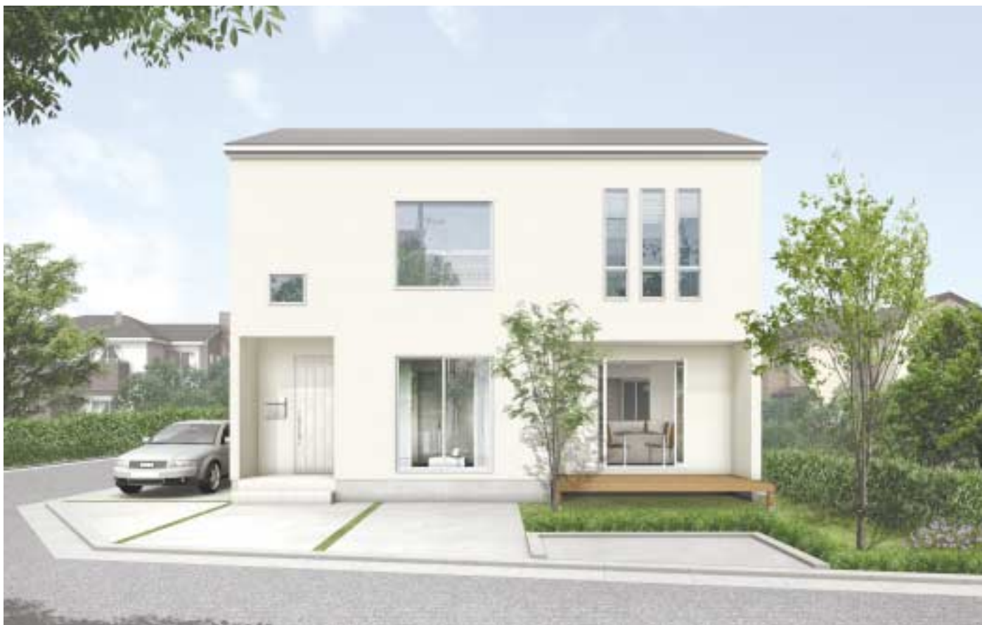
ご希望の方にモデルハウスお譲りします。